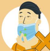
Do not remove the mask to talk to someone or do other things that would require touching the mask