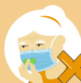
Do not touch the front of the mask