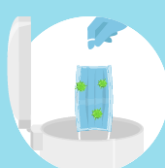
Discard the mask immediately after use preferably into a closed bin