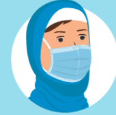
Adjust the mask to your face without leaving gaps on the sides