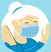
Avoid touching the mask