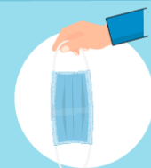
Inspect the mask for tears or holes