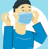
Remove the mask from behind the ears or head