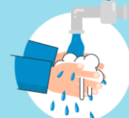
Wash your hands after discarding the mask