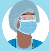
Ensure the colored-side faces outwards