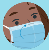
Place the metal piece or stiff edge over your nose