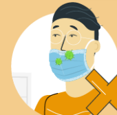
Do not wear the mask only over mouth or nose