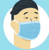
Cover your mouth, nose, and chin