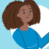
Keep the mask away from you and surfaces while removing it