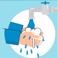
Wash your hands before touching the mask