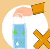
Do not Use a ripped or damp mask