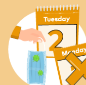
Do not re-use the mask

Remember that masks alone cannot protect you from COVID-19. Maintain at least 1 metre distance from others and wash your hands frequently and thoroughly, even while wearing a mask.