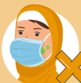
Do not wear a loose mask