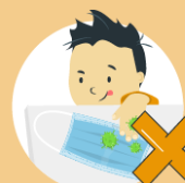
Do not leave your used mask within the reach of others